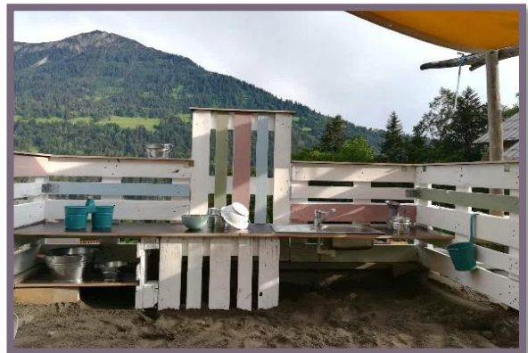
SANDKASTEN MIT MATSCHKÜCHE