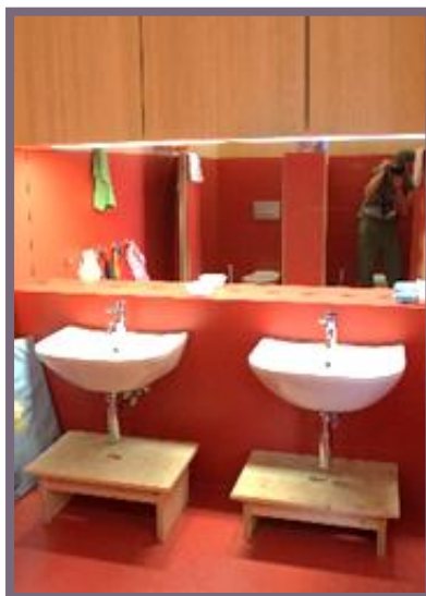
SANITÄRANLAGEN MIT 2 KINDER WC U. WICKELBEREICH